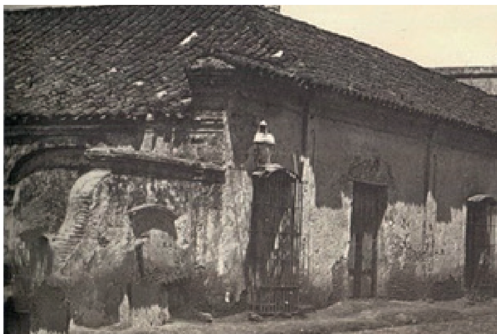
Hoy el solar no existe, se hallaba pegado y hacia el oeste de la actual escuela Guillermo Rawson