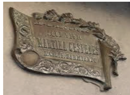
Placa conmemorativa del terreno donde vivió Martina Céspedes.

agradeció e inmediatamente le expresó que debía pedirle una gracia. Liniers, intrigado, preguntó cuál era. Ella respondió que sólo podía entregar a once de los prisioneros, porque había uno que quería su hija Pepa para casarse y tenía derecho porque había sido vencido por ella, además el elegido había manifestado el deseo de quedarse.