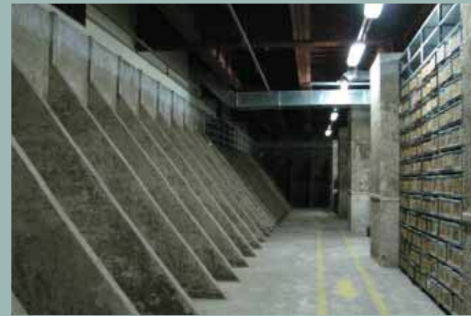
Archivo de planos.