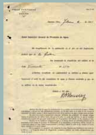
Solicitud firmada por Dr. Bernardo Houssey.