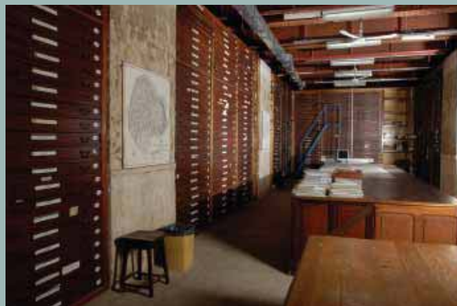
Sala de Archivo de planos.